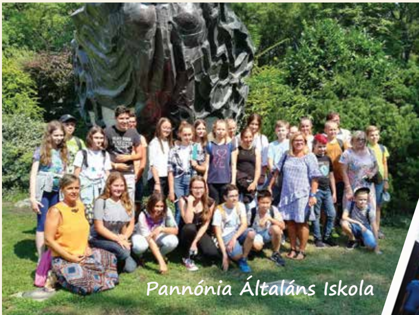
Pannónia Általános Iskola