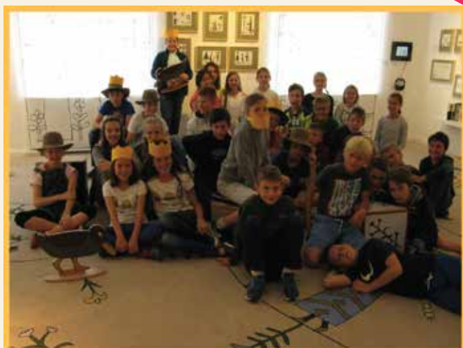
Németh Lászlósok 5.a osztály