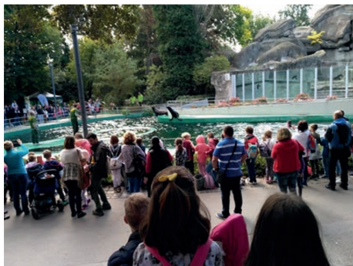
Fata Éva igazgatóhelyettes