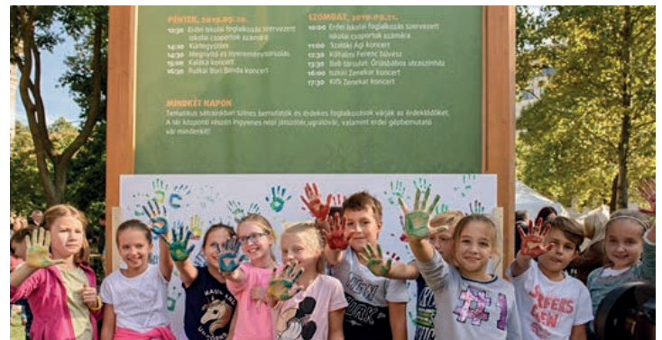
Hunyadi Mátyás Általános Iskola 4.b osztálya

Örülünk, hogy részesei lehettünk ennek a kezdeményezésnek, s mi is hozzájárultunk a Föld megóvásához. Reméljük jövőre is ott lehetünk!