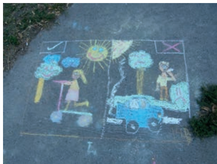
Csürke Gyöngyvér Öko munkacsoport

A legkisebbek pedig színes aszfaltrajzokat készítettek az iskolát körülvevő járdákon az autómentes közlekedés formáiról és a környezetvédelemmel kapcsolatban.