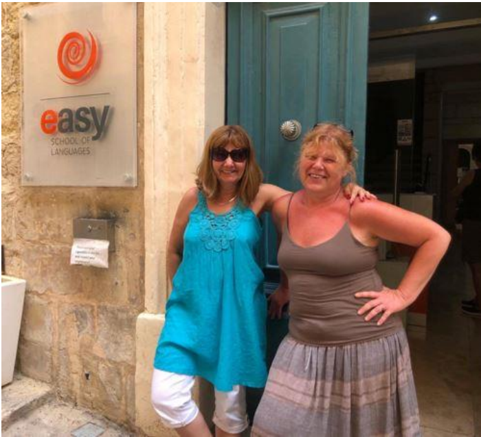
Easy School of Languages